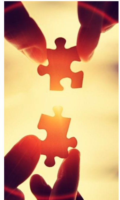
De puzzel moet worden gelegd

De Sociale Partners (Vakbonden en Werkgevers) beslissen uiteindelijk hoe de verdeling tot stand komt, uiteraard in overleg met het bestuur van het Pensioenfonds PME en na ook de standpunten van de pensioencommissie van de VGPME te hebben “gehoord”. Veel hangt uiteraard af van de financiële situatie (dekkingsgraad) van het pensioenfonds op het moment van de verdeling. Hoe hoger de dekkingsgraad van het fonds (thans ca. 117%) hoe beter aan ieders wensen tegemoet kan worden gekomen.