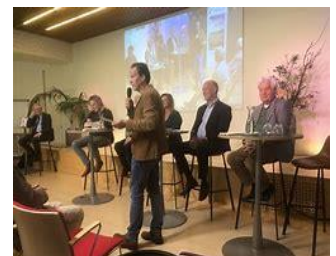
Voorlichtingsdag Hoorrecht georganiseerd door de Koepel Gepensioneerden

Er geldt een wettelijk hoorrecht voor verenigingen van gepensioneerden met tenminste 1000 leden en voor verenigingen van voormalige deelnemers van pensioenfondsen. Deze verenigingen krijgen de mogelijkheid om aan sociale partners een oordeel te geven over het voorstel hoe de huidige pensioenen worden omgezet naar de nieuwe pensioenregeling. Onze vereniging telt ruim 800 leden echter daarmee voldoen we niet aan de gestelde eisen. Om toch onze inbreng te hebben trekken we samen met de vereniging VG Siemens op in het overleg met de VG PME. In totaal hebben we samen ca 4500 leden en daarmee ruim voldoende om van het hoorrecht gebruik te kunnen maken. De VG PME heeft zich hiervoor dan ook aangemeld en zijn we als betrokken partij geaccepteerd. Bij de voorbereiding hiervan en de vervolgstappen hebben we dankbaar gebruik gemaakt van de uitgebreide kennis van de Koepel Gepensioneerden. We hebben daar ook de verschillende informatie dagen bijgewoond en procedure documenten van gebruikt.