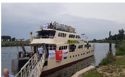
De "maashopper" voorzien van de verschillende vlaggen van VG-Océ, Océ en Canon.

De VG-Océ bestaat dit jaar 25 jaar. Het bestuur van de vereniging wilde dit jubileum niet onopgemerkt voorbij laten gaan.