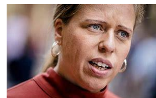
Minister Schouten Verantwoordelijk voor de invoering van de pensioenwet

Op dinsdag 30 mei heeft een meerderheid van de senatoren in de Eerste Kamer de Wet Toekomst Pensioenen aangenomen. Zijn we er nu? Nee, eigenlijk begint het pas. Samen met VG PME en de KG gaat VG-Océ er alles aan doen om te zorgen dat invoering van het nieuwe stelsel niet nadelig voor gepensioneerden gaat uitpakken. Samen met VG Siemens trekken we samen op met de VG PME om middels het hoorrecht onze wensen en eisen in te brengen in het overleg met de sociale partners, ofwel de vakbonden en werkgevers. Zie artikel over 8. hoorrecht.